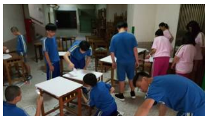
9.學生用廢棄課桌椅打造咖啡廳一隅