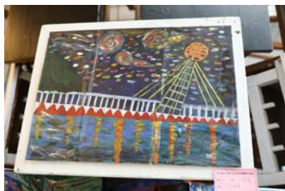
1.視覺藝術轉化星夜，畫出汐止在地的星光橋夜景星空橋