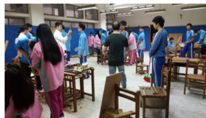
8.生活科技課程打造星空咖啡館