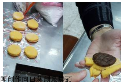
6.以麵團創作向日葵創意饅頭