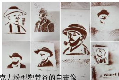
5.以巧克力粉型塑梵谷的自畫像