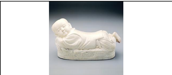
定窯<白瓷嬰兒枕>素淨典雅的定窯白瓷

人士頗注重之。同時磁州瓷另有一特色，堆花的技巧甚優，於黑色釉地作出各種紋樣，再敷以青釉面，顯出奇特色澤的效果。 建窯 在福建的建陽，是宋代著名的青白瓷，灰暗的胎骨，經燒後呈紫褐色，釉面厚潤。建窯有別出一格的黑釉瓷，頗為名貴，呈濃紺褐色，有時呈青光，有斑紋，製品細雅有緻。 龍泉窯 在浙江龍泉，是南宋最大名窯，燒青瓷為主，當時產品之盛，暢銷海外。龍泉的胎地呈白色或灰色，瓷質堅實細緻，經火候現橘紅色，釉有粉青、天青、翠青、葱翠青及淺青等，呈魚子紋樣，瑩潤明快，充分表現宋人簡潔深遠的精神。