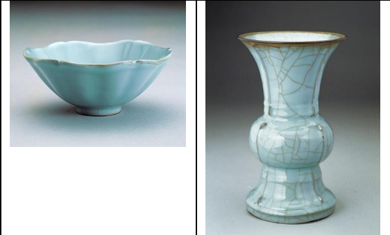
官窯< 瓷葵花碗> 官窯<青瓷尊>