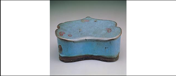
鈞窯<天藍紫斑如意枕>釉色絢麗的鈞窯